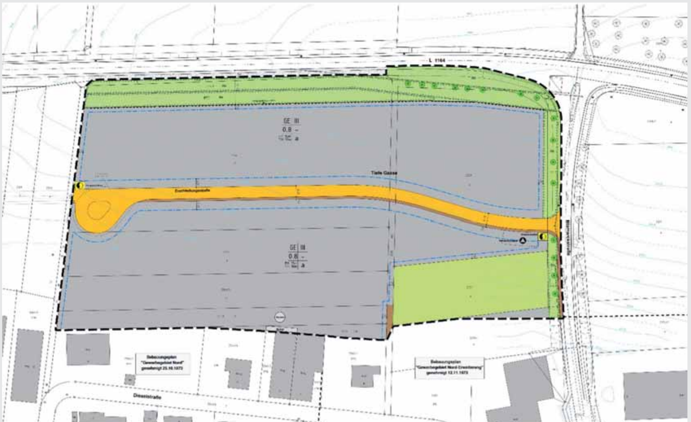
Ausschnitt Bebauungsplan „Tiefe Gasse“, genordet, unmaßstäblich