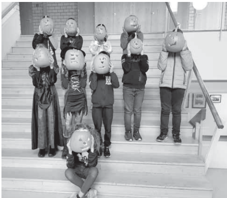
Herbstliche Kürbisköpfe der Klassen 5 der Realschule