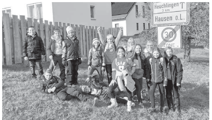
Kennenlerntage der Klassen 5a und 5b in Hausen.