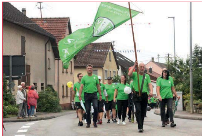
Ganz schön zu schleppen hat der Fahnenträger des TSV Gussenstadt beim Festzug zum 100. Geburtstag des Musikvereins Gussenstadt.

Ein weiterer Höhepunkt des Nachmittags war der Auftritt der „Herrn Stumpfes Zieh & Zupf Kapelle“. Sie waren eigens zum Jubiläum zum Festzelt gereist, um dem Musikverein Gussenstadt mit dem Lied „Ostalb-Herz“ zu gratulieren.